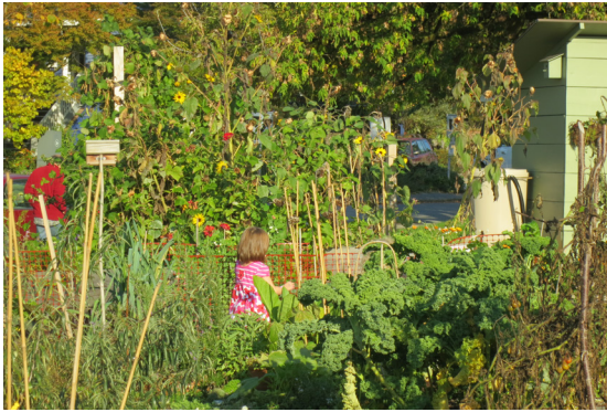
© Gemeinschaftsgarten in Vancouver, Wikimedia Commons: Ruth Hartnaub, CC BY 2.0 Deed

Wissenschaftlich gedeutet wird diese zunehmende Thematisierung und gesellschaftliche Relevanz von Heimat weitgehend übereinstimmend als Reaktion insbesondere auf Modernisierungs- und Globalisierungsprozesse, die zu beschleunigten Veränderungen der vertrauten Lebenswelt führen, grundlegende Veränderungen in der persönlichen Lebensgestaltung erfordern und Gefühle eines „dis-embedding“ (Anthony Giddens) hervorrufen können. Darauf reagieren offenbar viele Menschen mit einer Sehnsucht nach einer begrenzten, vertrauten und kontrollierbaren Lebenswelt, für die in vielen Fällen „Heimat“ steht.